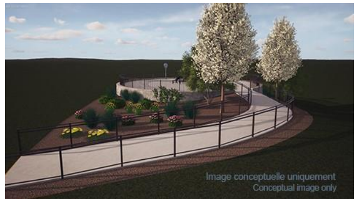
Rendu de la conception du parc Malden.

Image conceptuelle uniquement Conceptual image only