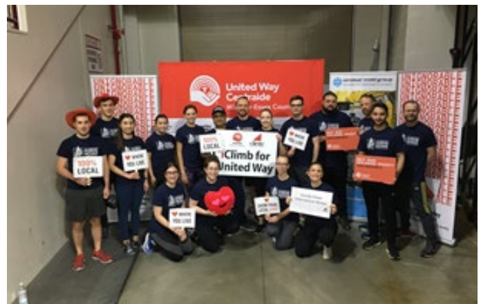
En mars, l'équipe du Pont international Gordie-Howe a participé une nouvelle fois à l'événement annuel iClimb de Centraide et a aidé à recueillir des fonds pour lutter contre la pauvreté infantile dans le comté de Windsor-Essex.