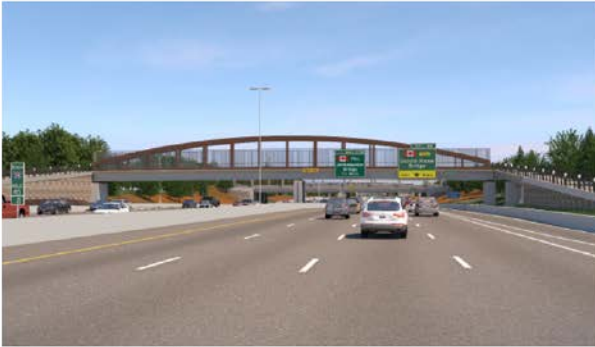
Vista de día desde la I-75

Luego de extensas consultas con la comunidad durante un periodo de tres meses, el Departamento de Transporte de Michigan (MDOT), la Ciudad de Detroit y otras partes interesadas clave, se eligió un diseño como la alternativa preferida para los puentes. La consulta incluyó reuniones de información pública, eventos para fomentar la participación y una encuesta en línea que brindó la oportunidad a los interesados de aprender más sobre las tres opciones de diseño. Más de 500 personas votaron sobre las tres alternativas de diseño y el diseño de "arco" recibió la mayoría de votos. Se tomaron en cuenta los comentarios en el diseño estético final de los puentes peatonales.