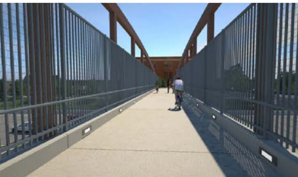
Vista de día desde el interior del puente