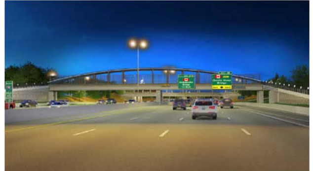
Vista de noche desde la I-75