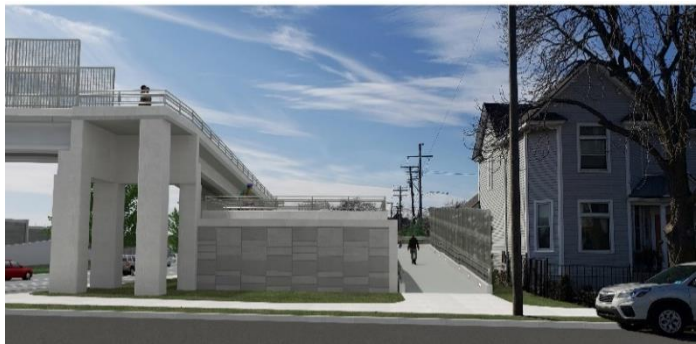
Viendo hacia el oeste en Junction St.