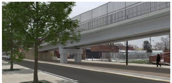
Viendo hacia el suroeste sobre Junction Street