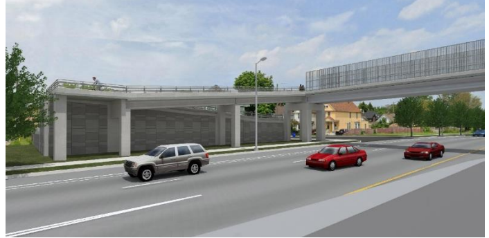
Vista desde Fisher Service Drive en dirección sur