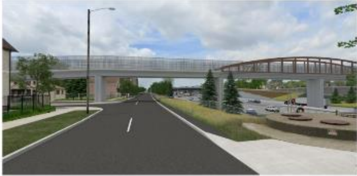
Viendo hacia el oeste sobre Northbound Service Drive